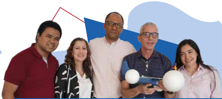
Participantes Open Finance Medellín

Los talleres contaron con la participación de entidades financieras, expertos en riesgo y análisis de datos que compartieron conceptos clave de Open Finance y su potencial estratégico dentro de las entidades financieras.