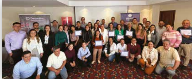
Taller de riesgos financieros en alianza con Bancóldex en Bogotá D.C.

Esta iniciativa, que se realiza en el marco de una carta de intención firmada entre Bancóldex y FE para el fortalecimiento de instituciones financieras , realizó un diagnóstico inicial y determinó un plan de mejora para cada institución durante seis meses. Las instituciones participantes, además, han accedido a un cupo de crédito del Programa Vincúlate y Crece de Bancóldex .